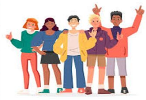
designed by freepik